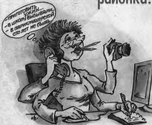
Такие журналисты приживаются в «СП».